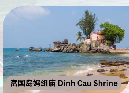
富国岛妈祖庙 Dinh Cau Shrine

酒店：Phu Quoc Ocean Pearl Hotel **** 或同等级酒店