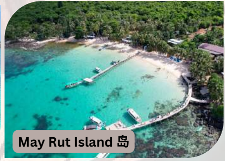
May Rut Island 岛

酒店：Phu Quoc Ocean Pearl Hotel **** 或同等级酒店