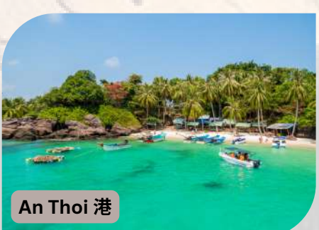
An Thoi 港