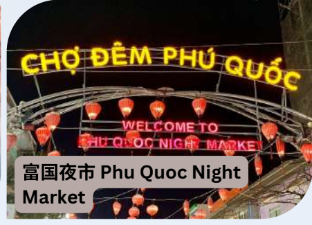
富国夜市 Phu Quoc Night Market

酒店：Phu Quoc Ocean Pearl Hotel **** 或同等级酒店