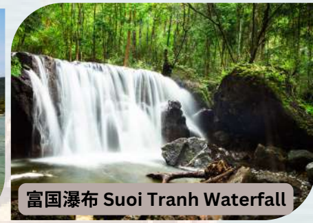
富国瀑布 Suoi Tranh Waterfall