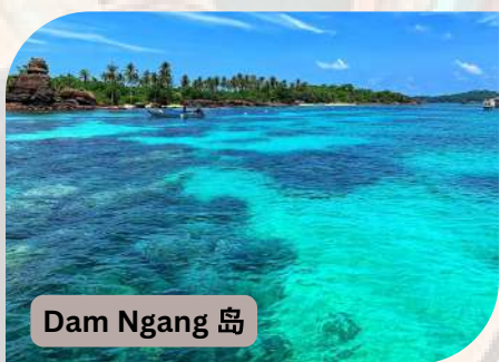
Dam Ngang 岛