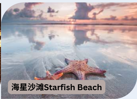
海星沙滩 Starfish Beach