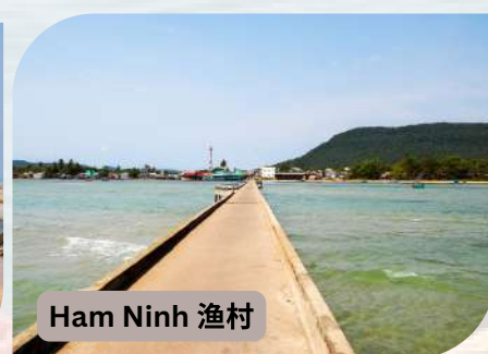
Ham Ninh 渔村