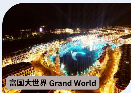
富国大世界 Grand World