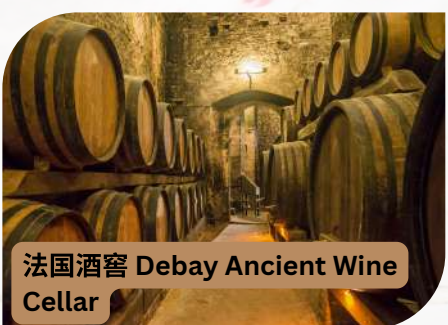
法国酒窖 Debay Ancient Wine Cellar