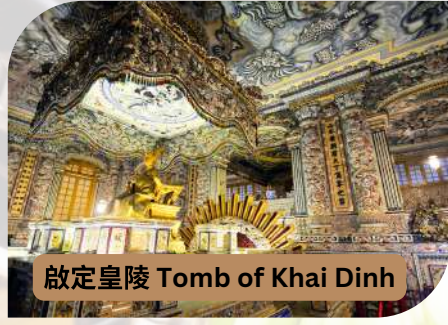
启定皇陵 Tomb of Khai Dinh