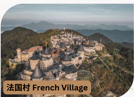
法国村 French Village