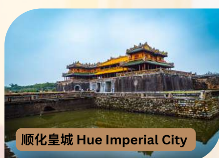
顺化皇城 Hue Imperial City