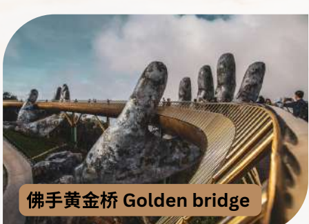
佛手黄金桥 Golden bridge

酒店：Hoi An Blue Sky Boutique Hotel & Spa **** 或同等级酒店