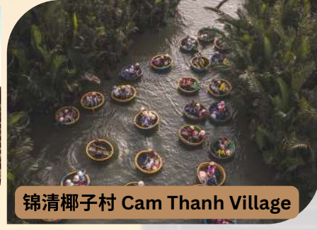
锦清椰子村 Cam Thanh Village