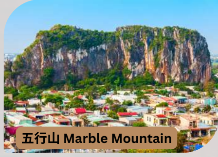
五行山 Marble Mountain