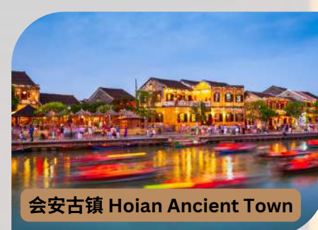
会安古镇 Hoi An Ancient Town

酒店：Hoi An Blue Sky Boutique Hotel & Spa **** 或同等级酒店