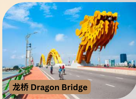
龙桥 Dragon Bridge