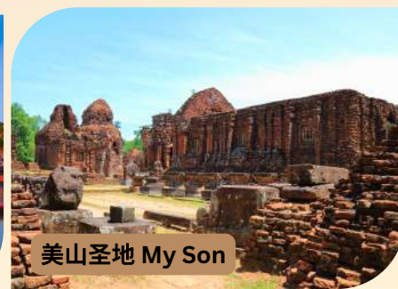
美山圣地 My Son