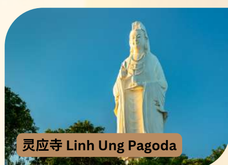
灵应寺 Linh Ung Pagoda